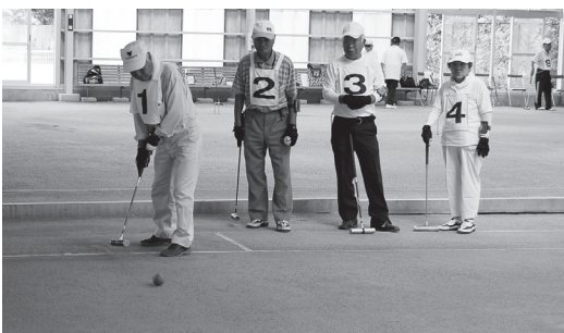
ゲートをめがけスティックを振る参加者

また、8月5日には、同じく本宮市夏まつり協賛の第10回ゲートボール大会が、白沢シルバースポーツセンターで開催。4チーム23人が参加し、自慢のスティックさばきで、「あがり」を目指しチーム一丸となって勝負しました。