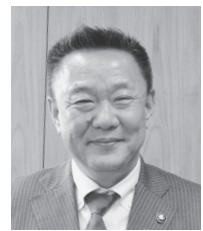
本宮市長 高松 義行