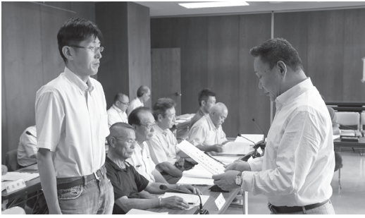
高松市長から委嘱状が手渡される委員の皆さん

当委員会では、五百川駅前広場の歩行者・自転車の安全確保と、送迎する自動車のスムーズな動線を確保するための整備計画案に関する検討などを行っていきます。