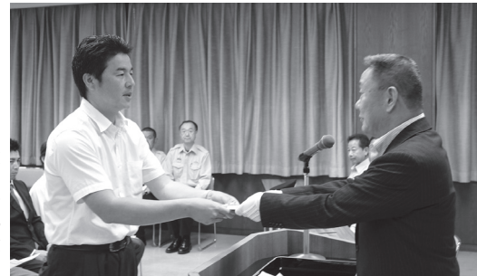
永年の防災活動、お疲れ様でした！

7月31日、本宮市役所で消防団退職報償交付式が執り行われ、永年消防団員として地元の防火・防災に尽力された31人に報償金と感謝状が贈られました。