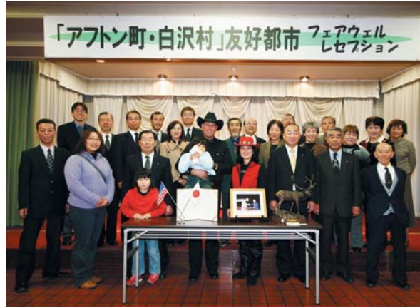
参加した皆さんとの記念撮影