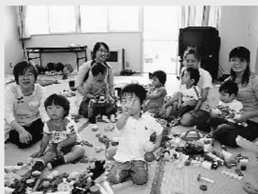
皆さんの子育てを応援します

自分も楽しみながら、子どもたちの支えになりたいという思いで、いつの間にか力が入るパパです。