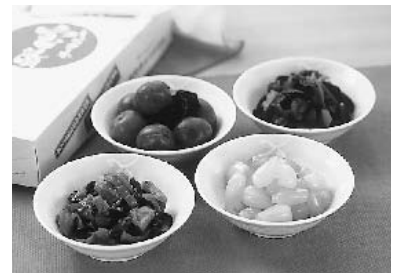
新鮮野菜をふんだんに使った 「しらさわ宝漬」

ヤーコンときゅうりをしよ うゆ漬けにした「やつこちや ん漬」、あまくておいしい「カ リカリ梅漬」、「らつきよう 漬」、「しいたけおかか」など など……。昭和60年に旧白沢 村の各地区農産加工グループ の皆さんが設立した、白沢農 産加工グループは、白沢のお 母さん方が集い、野菜をはじ めとした農産物を漬物に加工 して販売しています。