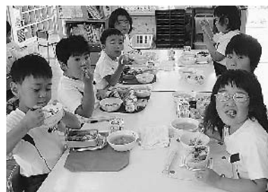
手作りランチョンマットで食事 「おいしい。」

伸びとできる自転車乗りへの 挑戦、これまで多くの子ども たちが乗れるようになってい きました。 また、園庭内に畑があり、 毎年様々な野菜を世話しなが ら育て、収穫して味わってい ます。今年度最初の収穫は、 年長組の二十日大根でした。 「見て～、こんなに大きくなっ たよ。」 「こっちは小っちゃい。」 「これ食べていい？」 「うわ～からかい。」 「からいけどおいしいよ。」 などと、収穫の喜びを満面に 表していました。年少組の子 どもたちも、収穫した野菜で サラダづくりをする様子を見 守り、みんなでおいしくいた できました。 それから、食事をする環境 づくりのひとつとして、保護 者有志のボランティア協力を 得て、ランチョンマット作り