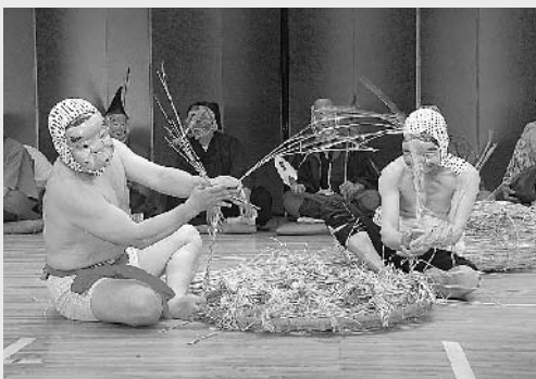
おどけたしぐさでマブシ(養蚕用)を編むひよっこ