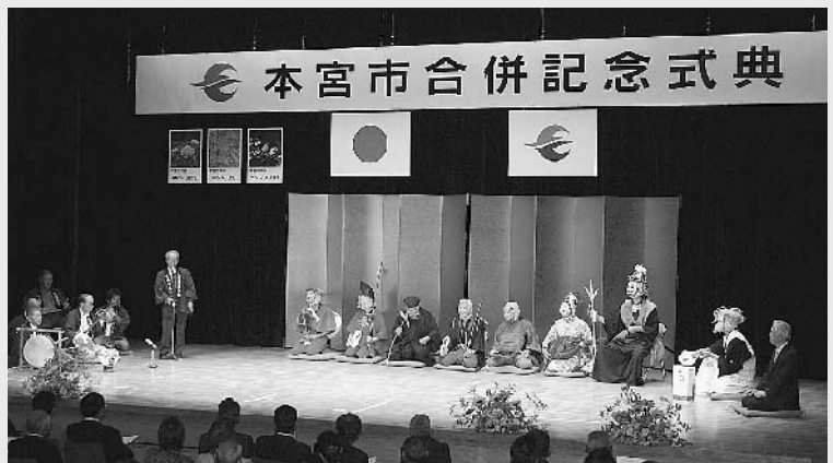
本宮市に福を呼び込む「八ッ田内(やっとうち)七福神舞」