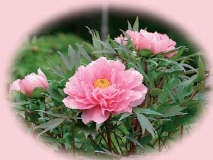
市の花 ぼたん(牡丹)

本宮市のシンボルとなる、花・木・鳥が決定しました。市民の皆さんからご応募いただいた中から、市のイメージにふさわしいものが選ばれましたのでご紹介します。