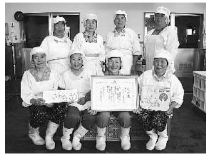
平成8年に福島県農業賞を受賞