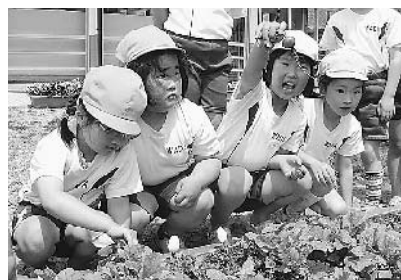
ね～、こんなに大きくなったよ！ (二十日大根の収穫)

和と田幼稚園の周りには、ザ リガ二とりのできる堀やどん ぐり拾いのできる雑木林など 豊かな自然が広がっています。 こうした自然を生かし親しむ 保育も大切にしています。が、 日々生活する園庭の広さとそ こで繰り広げられる子どもた ちの遊びや活動が何よりの自 慢です。 たとえば、広い園庭で伸び