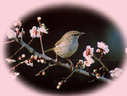
市の鳥 うぐいす(鶯)