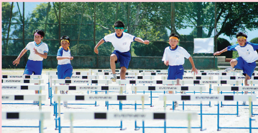
前へ高く、速く！ 6年生男子「80mハードル走」