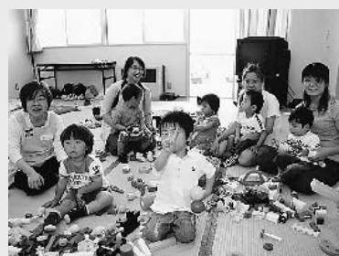
皆さんの子育てを応援します

「育児疲れでリフレッシュしたい」「ゆつくり買い物へ行きたい」「そんな時は、さくらんぼほほすをご利用ください。お子さんの一時預かりをはじめ、お子さんと一緒に遊んだり、お母さん同士の交流の場として、月2回実施していますので、公園に行くような気持ちでお気軽においでください。お父さんやおじいちゃん、おばあちゃんのご利用もお待ちしています。