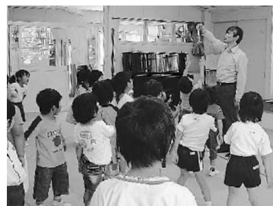
毎月行われている「音の広場」

を行いました。その後、お母 さんたちがアップリケや刺繍 をして素敵に完成させてくれ ました。一人二枚あるラン チョンマットはその日の気分 で選ぶことができ、楽しく食 事をしています。食事の仕方 もさらに上手になりました。 そのほか、わらべうたを中 心として、仲間や教師と遊ぶ 月1回の「音の広場」が、子 どもたちの大好きな時間です。 遊びや食事の準備の時などの ちよつとした生活の場面でも 手遊びを交えながら自然と旋