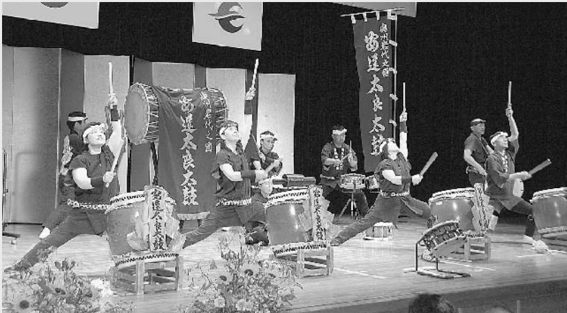
◀「奥州岩代之国安達太良太鼓」の力強く勇壮な響き