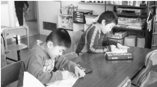
児童クラブで静かに勉強に励む子どもたち

そして、子どもたちの一番好きなおやつ(の時間)では、月に一、二度手作りのおやつを出しています。簡単に作ったおやつでも「先生、ありがとうございます」と言ってくれて、喜んで食べてくれるので、次はおいしいものを作ってあげたいと力が入っています。 今後、児童クラブの利用者はますます増えてくると考えられます。放課後の時間、子どもたちが充実した日々を過ごせるそんな場所を作りたいと思います。