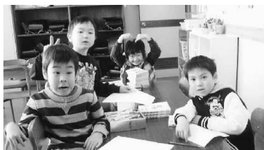
児童クラブでは学年が違う子どもたちが仲良く過ごします