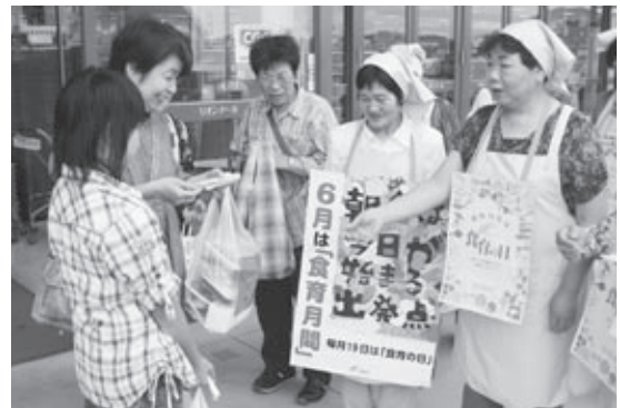
◀食育の啓蒙活動の様子。

早朝にもかかわらず、この運動に参加された皆さんや駅利用者の皆さんは、明るくあいさつを交わしていました。