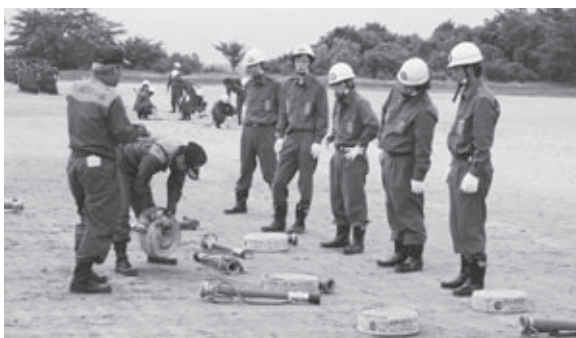
◀移動消防学校の訓練の様子。

7月5日に福島県消防協会本宮支部は、白沢体育館と白沢運動場で、消防団幹部や新入団員を対象とした移動消防学校を実施しました。 今年、本宮市消防団と大玉村消防団から約260名が参加し、南消防署と福島県消防学校から講師を迎え、規律、礼式、操法訓練などを行いました。