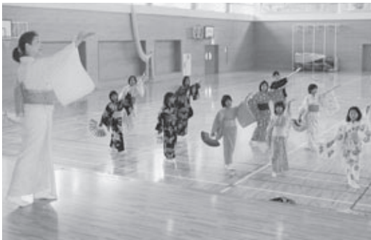
▶日本舞踊を体験する児童。

本宮小学校では、6月30日に6年生の社会科の授業として、「室町文化体験」を行いました。