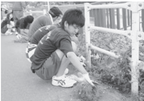
◀マリーゴールドを植える生徒。

7月14日に本宮第一中学校の生徒が市内の昭代橋付近の土手沿いにマリーゴールドを植えました。 当日、本宮第一中学校では体験学習が行われ、3年生は高齢者福祉体験活動を27班に分かれて行いました。そのなかのひとつの班では、安部生花店より寄付のあったマリーゴールドの苗、約400本を本宮8区ふれあいサロンの方とともに植えるなど、地域の皆さんとふれあいながら楽しく学習しました。