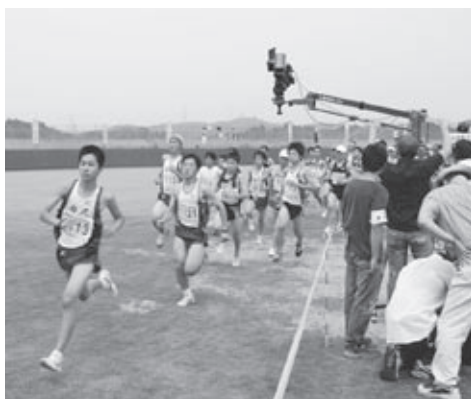
▲ロードレース大会での撮影の様子

なお、撮影の際は本宮市の腕章をつけ、市で撮影していることが分かるようにいたします。