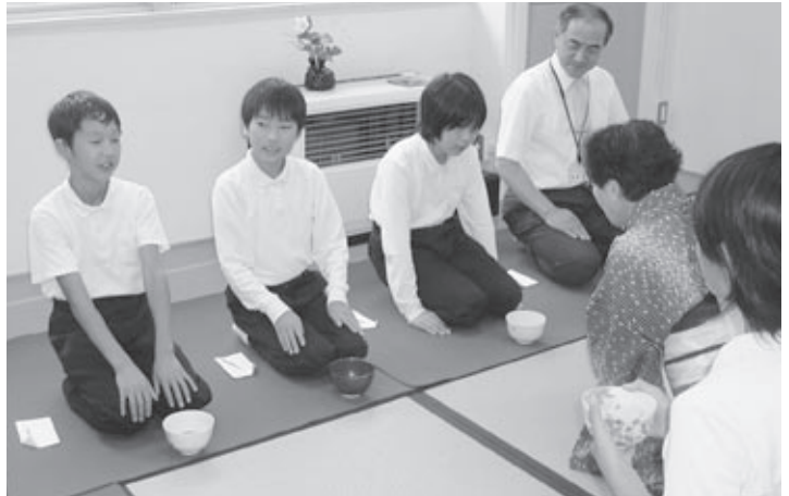
▲茶道を体験する児童。