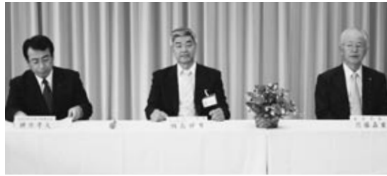
▲写真右から佐藤市長、綱島輝男社長、横井孝夫 県北地方振興局長