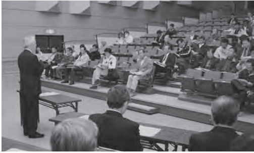
▲行政区長会議の様子