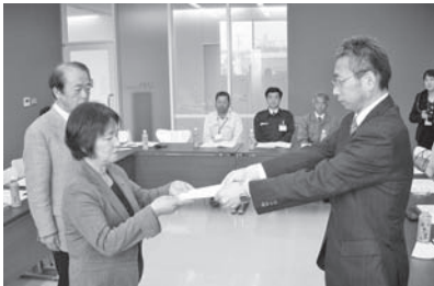
▲人権擁護委員委嘱状交付