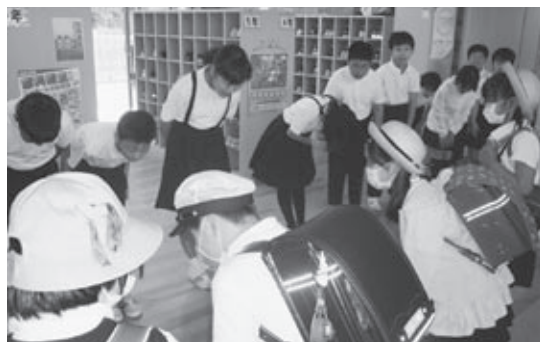
▶毎朝元気にあいさつします。朝の「あいさつ運動」の様子