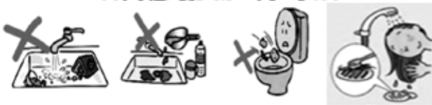
野菜くずや食べ残、天ぷら油などの廃油、水洗トイレ用の紙以外、髪の毛