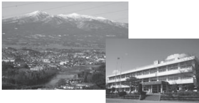
▶高松山からの風景

及び交通安全とラジオ体操の集い」には地域から約500人が参加し、交通安全作文の朗読やラジオ体操で地域の心をついにします。 また、保護者で組織する学校支援ボランティアが、「読み聞かせと図書整理」「校外行事における児童の安全確保」「校舎内の環境整備」の為に来校し、児童の活動を支援しています。 主役である206人の児童は、日々の学び合う授業と習慣化した家庭学習によ