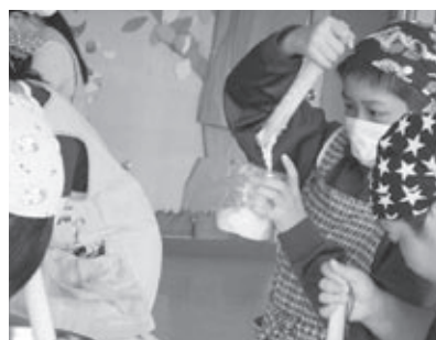
▲餅をついている様子

だくことができました。これからも、ゲーム集いや6年生を送る会など、多様な異年齢の子どもたちからなる集団による活動を通