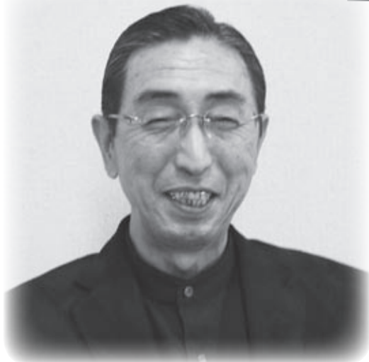
▲「真結女御輿は縁結びの御輿なんですよ。」と真結女御輿の名前の由来を話す根本会長