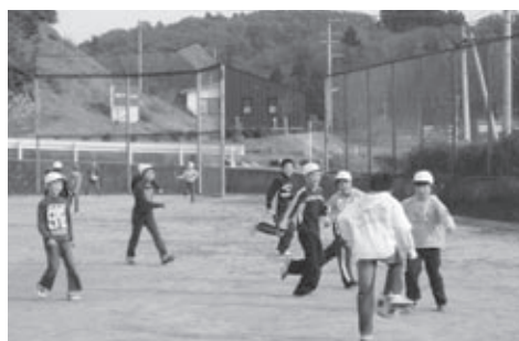
▲元気いっぱいに校庭を駆け回る児童

子どもたちも手が離れ、ようやく自分の時間が持てるようになり、今は、お菓子づくりと親しい仲間との日帰り温泉旅行が一番安らぐひとときです。