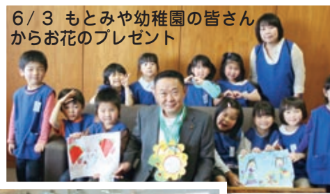
6/3 もとみや幼稚園の皆さんからお花のプレゼント