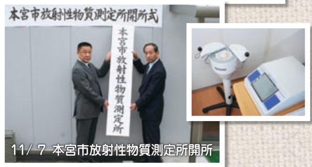
本宮市放射性物質測定所開所式