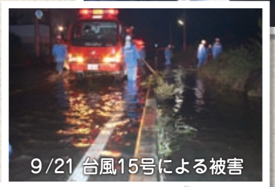
9/21 台風15号による被害