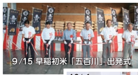
9/15 早稲初米「五百川」出発式