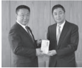
▲左から高松市長と米津代表取締役