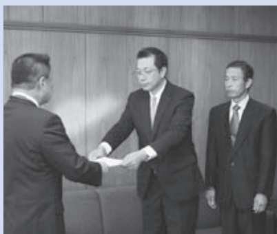
▲高松市長へ答申する伊豆会長（中央）と石川副会長（右）

市では、この答申を受け、市民が利用しやすい行政組織となるよう「組織機構見直し案」を再確認し、24年度から新組織体制で業務に取り組む準備を進めています。