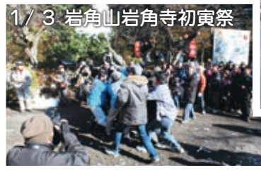
1/3 岩角山岩角寺初寅祭

各地に取材に出かけ、皆さんとお話させていただき、その強さひたむきをヒシヒシと感じています。取材させていただいて、掲載できなかった写真を織り混ぜながら、23年を振り返ります。