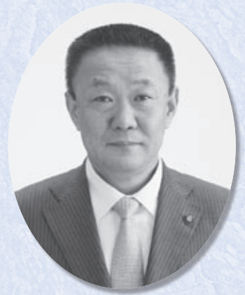
本宮市長 高松 義行