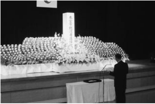
▲戦没者のご冥福をお祈りしました

11月10日に本宮市戦没者追悼式が、戦没者の遺族および関係者約80人が参列して、サンライズもとみやで行われました。