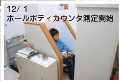
12/1 ホールボティカウンタ測定開始