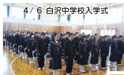
4/6 白沢中学校入学式