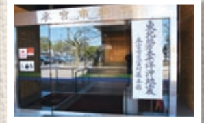
3/11 東日本大震災 災害対策本部設置