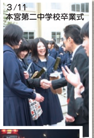
3/11 本宮第二中学校卒業式