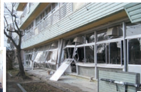
3/11 本宮第二中学校地震被害