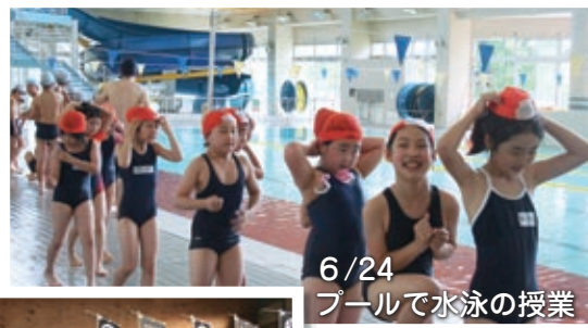
6/24 プールで水泳の授業