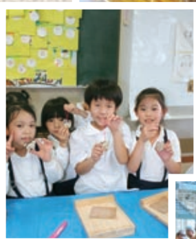
7/12 まゆみ遊友くらぶ 木工工作