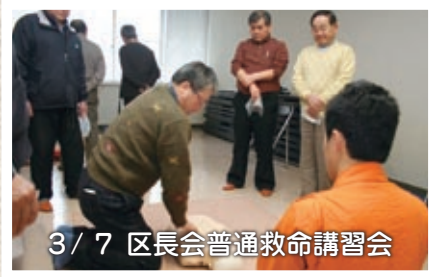
3/7 区長会普通救命講習会