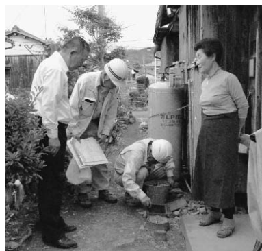
(左) 水道施設無料点検の様子 (右) 水道安全祈願祭の様子