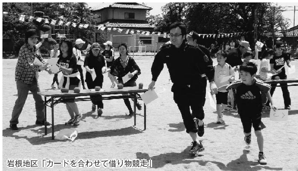
岩根地区「カードを合わせて借り物競走」

カメラ散歩では、皆さんの「ホットで楽しい」話題を掲載しています。皆さんからの情報もお待ちしています。