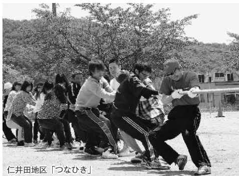
仁井田地区「つなひき」