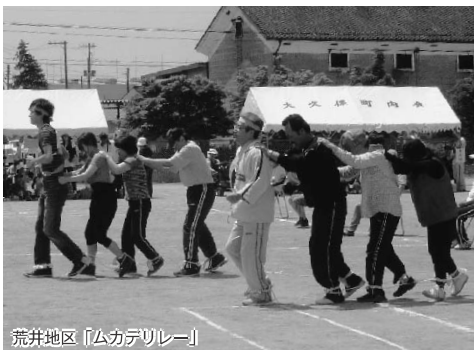
荒井地区「ムカデリレー」