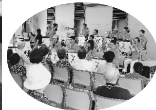
▼ 9月30日に行われたバースデーコンサートではファジーネーブルが出演しました

皆さんにご利用していただいている、えぼか3周年を迎えました。3周年を記念して、10月1日に誕生会を行いました。また、9月30日には前夜祭として、バースデーコンサートが開かれました。えぼかには、子どもからお年寄りの方まで多くの方がかけつけました。