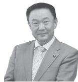
本宮市長 高松 義行