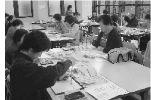
講座終了後、受講生の皆さんから、もっと続けたいと声上がり、今後はサークル活動として継続していくことになりました。

◆問い合わせ先 生涯学習センター（中央公民館内） 中央公民館図書室 本宮字矢来39-1 ☎33-2611 白沢公民館 白岩字堤崎500 ☎44-2350 しらさわ夢図書館 白岩字堤崎500 ☎44-2112