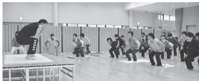
ボディリメイクスクールの様子

また、健康力アップ応援事業として「ボディリメイクスクール」を毎月えぼかで開催しています。体型が気になる！健康増進を図りたい！生活習慣を変えたい！と思っている方を応援します。申し込みは不要ですので、ぜひ参加してください。