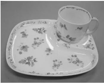
▲完成したオリジナルの食器

◆問い合わせ先 生涯学習センター (中央公民館内) 中央公民館図書室 本宮字矢来 39-1 ☎33-2611 白沢公民館 白岩字堤崎 500 ☎44-2350 しらさわ夢図書館 白岩字堤崎 500 ☎44-2112