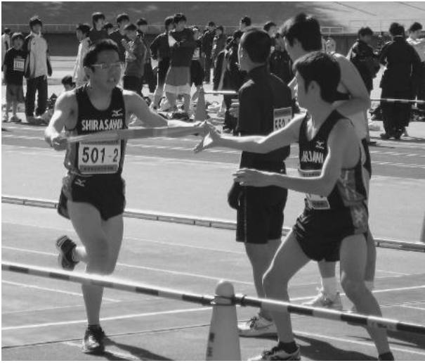
▲白沢中学校のタスキリレー

これは、東日本大震災以降、継続して支援していただいている埼玉県上尾市の配慮により、昨年10月に開催された「もとみや駅伝競走大会」で小学生の部と中学生駅伝の部でそれぞれ優勝した五百川小学校と白沢中学校が招待されたものです。