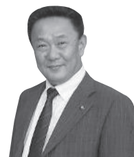
本宮市長 高松義行