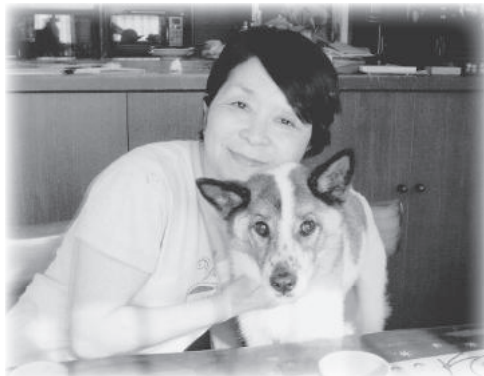
愛犬リンちゃんと思い出の一枚

「琴や読み聞かせの練習をしていると、リンはいつもいつのまにかそばに来ていました」と愛犬を懐かしみます。