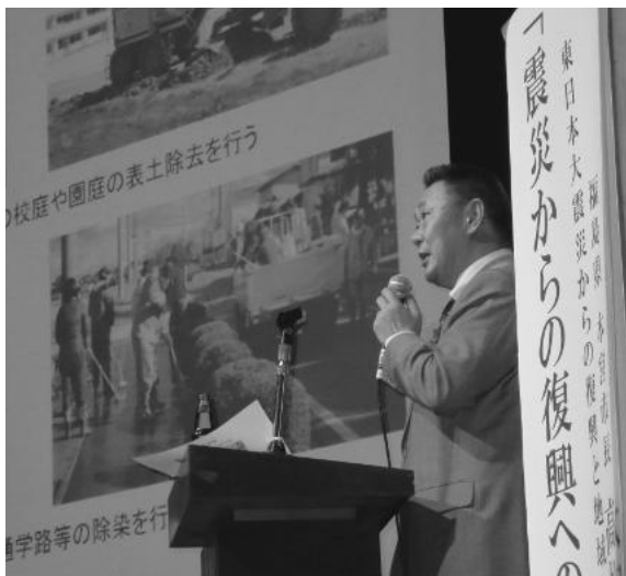
高松市長の講演の様子

高松市長は、震災後の本宮市の状況と、福島第一原発事故後の対応など、スライドを使って説明しました。