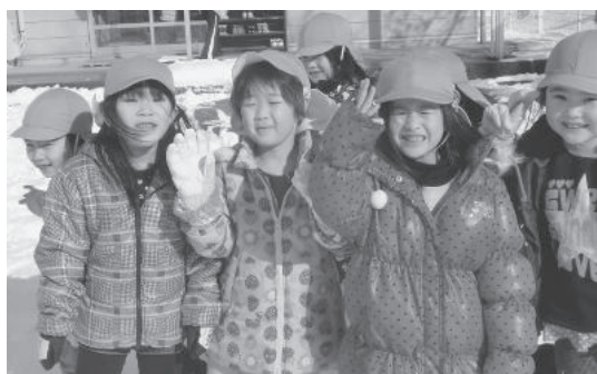
▲毎日元気に通っています

本宮第一保育所は、みずいる公園のすぐそばにあり、市の中心地とあって働くお父さんやお母さんにとっては利便性の高い場所にあります。 また、本宮町当時昭和29年に開所された、本宮市では最も歴史のある保育所です。現在1歳から就学前までの101人のお子さんをお預かりしています。 「元気で明るい子ども」「思いやりのある子ども」「力いっぱい頑張る子ども」の保育目標のもとに、第一保育所の子どもたちは元気に登園しています。 東北本線もすぐそばを走っていることから、昨年のSL