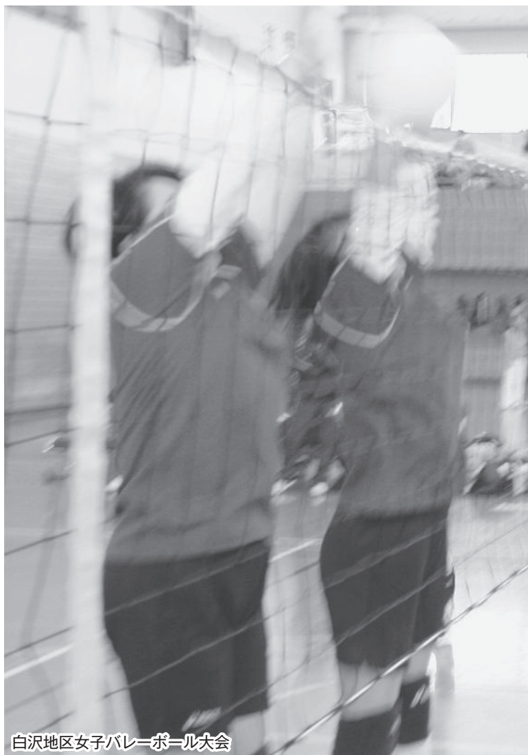
白沢地区女子バレーボール大会