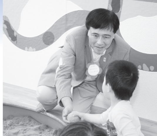
思いっきり遊べる砂場に子どもたちは夢中(右) 保坂展人世田谷区長がキッズパークを視察(上)

安全に通行できます 沢目・愛宕線の改良工事が完了 かねてより高木地区で改良工事を行っていましたが「沢目・愛宕線」の工事が8月に終了しました。 平成22年度より進めていた工事で、これにより地域の皆さんの交通の利便が図られます。