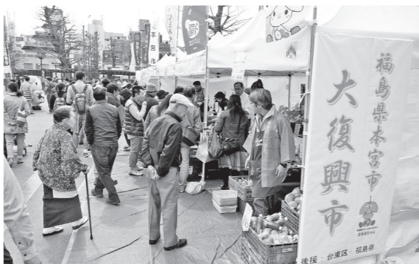
▲浅草での本宮大復興市