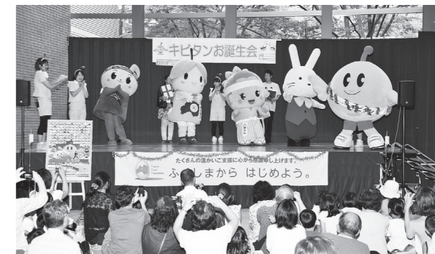
▲まゆみちゃんによる市のPR事業