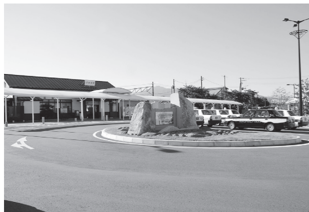
▲完成した JR 本宮駅前東口広場