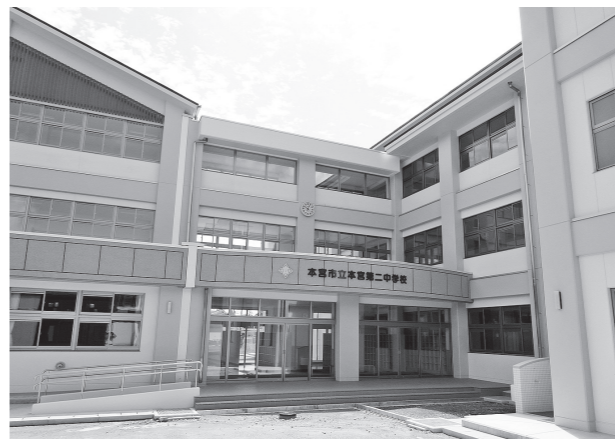
▲本宮第二中学校校舎の新築復旧