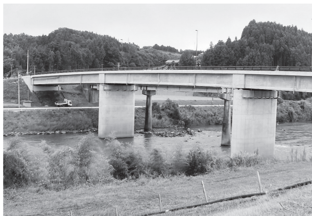
▲二本松と本宮を結ぶ菅田橋