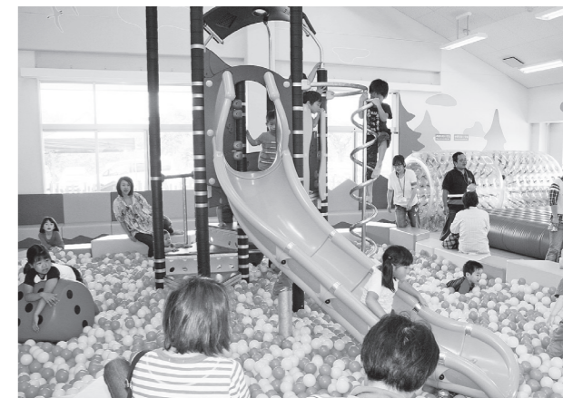
▲スマイルキッズパークオープン