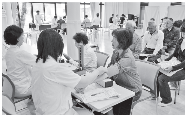
▲えぼかでの総合検診