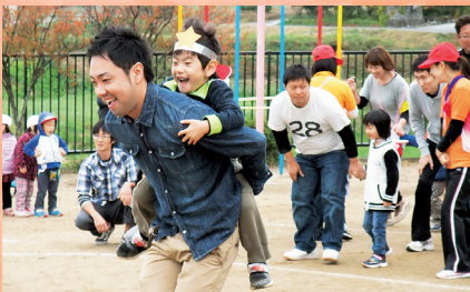
親子競技～うちのヒーロー（第二保育所）

あるという伝統の舞が奉納されました。 獅子舞は、地域の繁栄を願うもので、色とりどりの願い事が書かれた籠(さくら)と呼ばれる竹の枝は縁起ものとされ、参拝者に配られました。