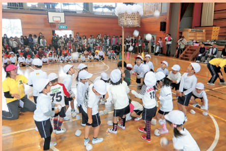
紅白玉入れ（おひさま幼稚園）