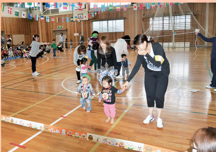
「あんよがじょうず」（白沢保育所）