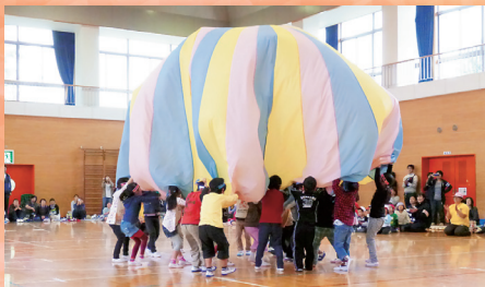
バルーン（第一保育所）