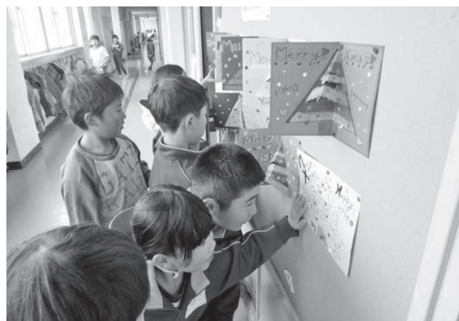
▲糠沢小学校の図書室前に掲示されたクリスマスカード

12月2日、本宮市と交流が続く神奈川県相模女子大学から復興応援のクリスマスカードが届けられました。