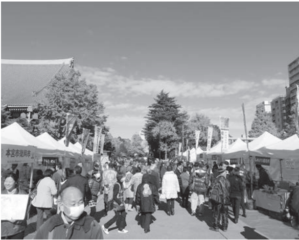
▲大勢の人でにぎわう浅草寺。2日間で約2万人の来場がありました

この復興市は、被災地である福島県の観光PRと本宮市の特産品等を販売することで、復興のPRと原発事故の風評被害対策の一助とすることを目的に、福島県と本宮市が主催したもので、多くの観光客で賑わう浅草寺で、観光福島と新鮮な野菜や果物など、本宮のおいしい食べ物をPRしました。