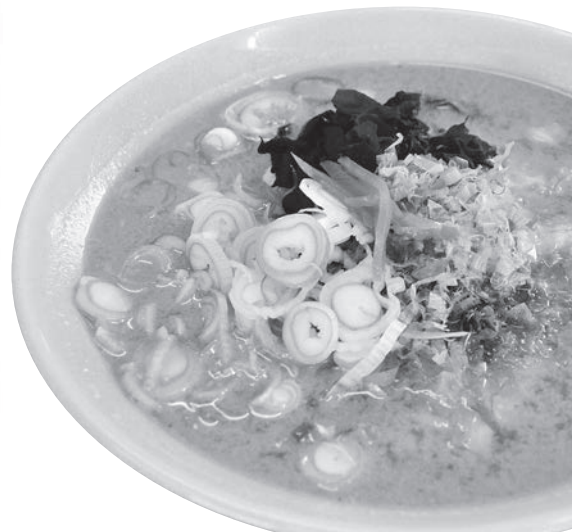
とろろをふんだんに使ったとろろかけラーメン®