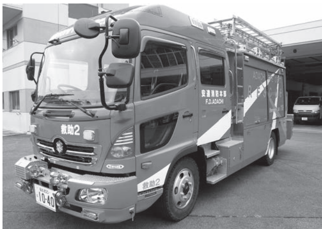
▲今回更新した救助工作車

この車両には、バッテリー式油圧救助器具、超高压噴霧装置、上昇式LED照明装置など最新式の救助資機材が搭載されています。今後は事故現場などで活躍し、皆さんの安全安心に寄与することが期待されます。