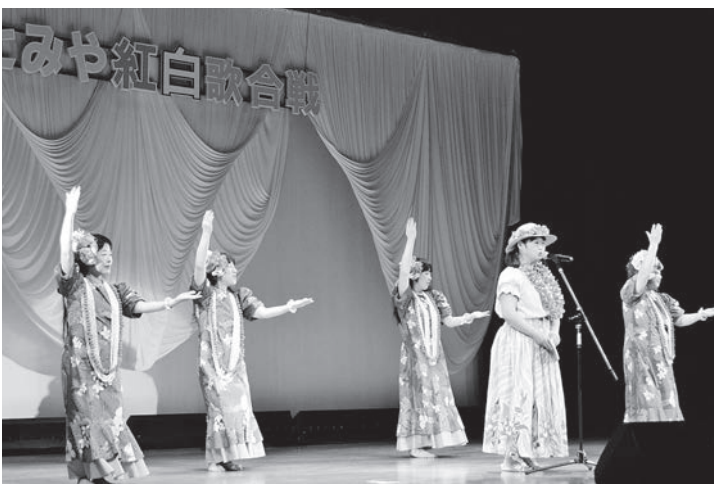
▲会場のサンライズもとみやには約400人のお客さんが歌を聴きに訪れました

また、実行委員会では、会場でチャリティ募金を募り、集まったお金を本宮市社会福祉協議会へ寄付しました。