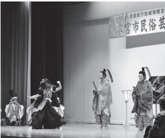
▲浮島神社太々神楽による「岩戸楽」は約50分にわたる超大作でした

第7回目となる今大会は、震災復興のため東京お茶の水・本宮両ロータリークラブの支援を得て、原発事故で本宮市などへ避難されている浪江町からは南津島の神楽、富岡町からは麓山神社御神楽舞が披露されました。また、「ふるさと浪江おどり隊」「富岡町老人クラブ女性部」もふるさとの思いを込めて出演しました。本宮市内からは、南部先囃子や春日神社太々神楽、浮島神社太々神楽、鹿島神社太々神楽が披露され、本宮市民と文化を通じた復興支援や地域間交流を図りました。