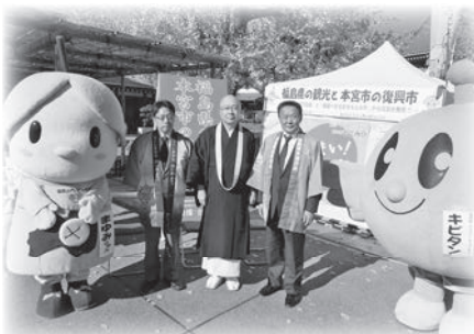
▲浅草寺守山執事長(中央)と飯塚福島県東京事務所長(中央左)