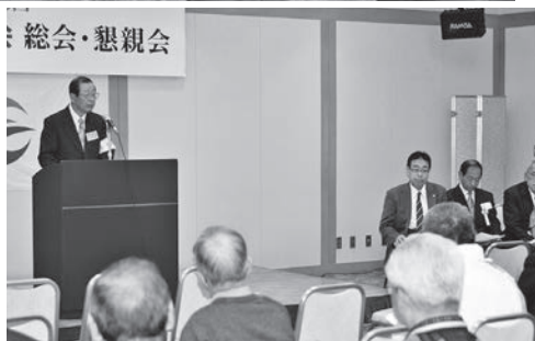
市とあだたら会の発展のため力を合わせていきたいと話す日向会長