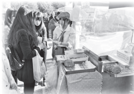
▲相模女子大学の学生も本宮産品の販売に協力