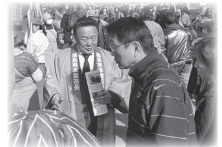
▲市長が本宮産品をPR