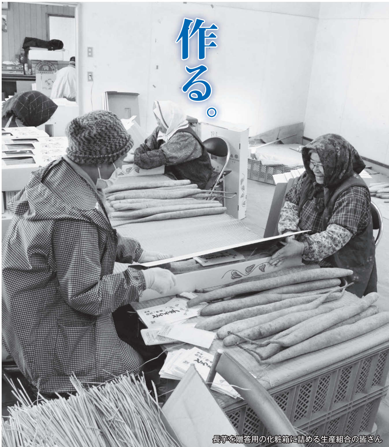
長芋を贈答用の化粧箱に詰める生産組合の皆さん