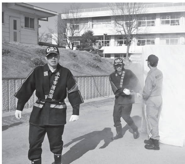
▲煙体験ハウスを体験した参加者

糠沢地域づくり協議会では、毎年防災訓練を実施しており、避難訓練、救命訓練、消火訓練、炊き出し訓練などを行い、防災意識の高揚を図っています。今年も、南消防署の協力を得て煙体験ハウスが用意され、火災の煙が立ちこめる中で避難することの難しさを体験しました。