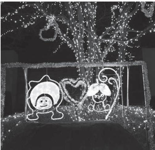
▲サンライズもとみや前のケヤキの木には、まゆみちゃんとアッピーが並んだイルミネーションが

期間中はイルミネーション写真教室やフォトコンテスト、2月14日のバレンタインデーのイベントなどが予定されています。