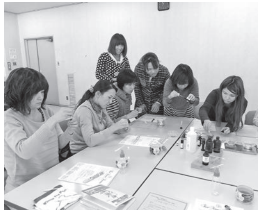
▲教室中にアロマの良い香りが広がり、心地よい学習会でした

日ごろの子育ての忙しさをしばし忘れ、アロマの香りに包まれたリラックステキな時間を過ごすことができました。