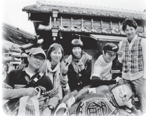
伊勢参り。おかげ横丁にて