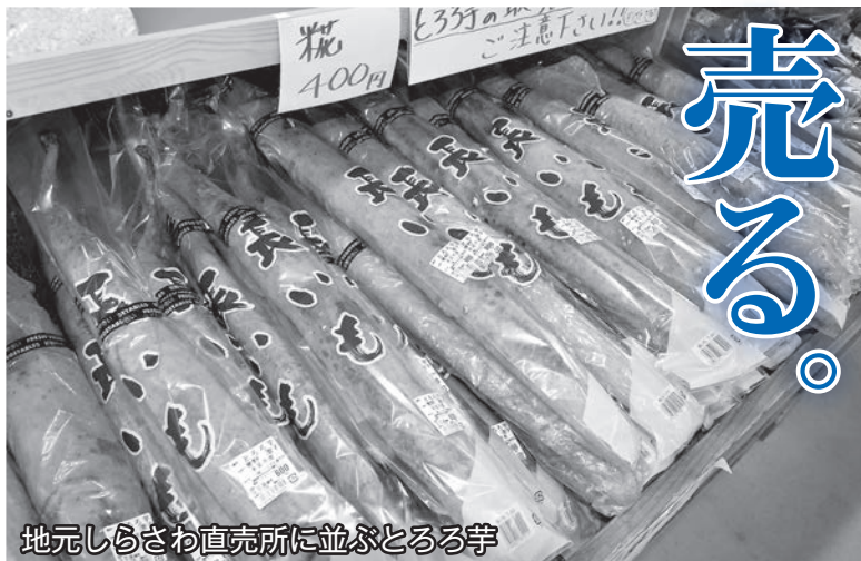
地元しらさわ直売所に並ぶとろろ芋