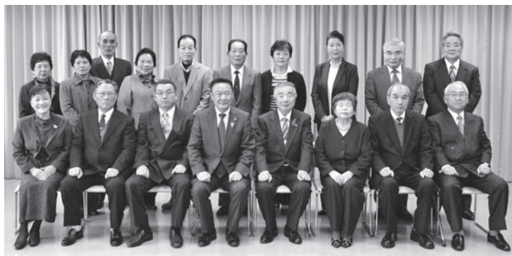
▲長年活躍された民生委員・児童委員の皆さん