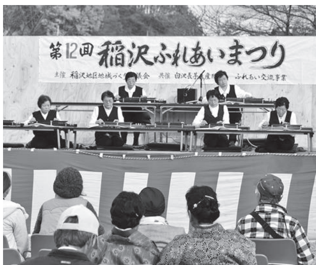
▲地元の秀峰会稲沢教室の皆さんによる大正琴の演奏

また、県の地域づくりサポート事業の助成を受け、地元野菜の販売、学生ボランティアによる子どもたちの交流広場なども行いました。天候にも恵まれ、会場には老若男女約600人のお客さんが訪れました。