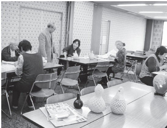
▲思い思いの模様のランプを作りました

中身を取りだし、乾燥させたひょうたんの表面にデザインを描き、棒ヤスリで一つ一つ穴をあけていきます。そこから優しい光があふれだし、素敵なランプができ上がりました。