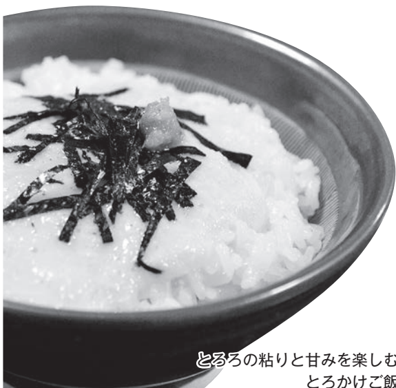
とろろの粘りと甘みを楽しむとろろかけご飯

そうした活動もあり、原発事故による風評被害により減っていた消費も回復し始め、昨年は、出荷した約2800箱すべて完売することができた。