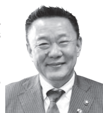
本宮市長 高松 義行