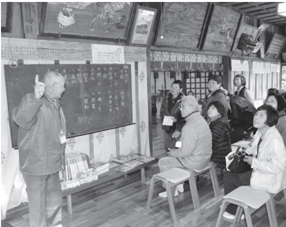
▲浮島神社の三十六歌仙の説明を受ける参加者の皆さん

いずれの旅も、市内はもちろん市外から大勢の人が本宮を訪れ、新しい本宮の一面に触れました。ツアーには、地元ボランティアガイドが付き、参加者は熱心にガイドの話に耳を傾けていました。