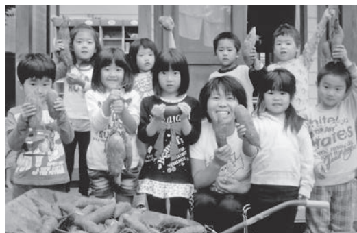
▲みんなでがんばったお芋掘り

赤ちゃんには、おもいきりハイハイやアンヨが保障されるように、布おむつ・布パンツでママや保育士の手塩にかけた保育で育てられ、どの子ども笑顔が多くかわいいた赤ちゃんに育って