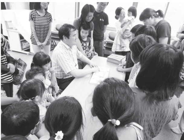
▲バリアフリーにふれる貴重な機会になりました