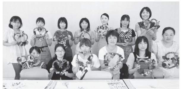
▲花や装飾品で飾った素敵なウェルカムリースができました

おはなし会では先生に点字の絵本を実際に読んでもらったり、全盲の先生がどのように絵本を読み、感じているかなどの体験をお話いただきました。参加者は子どもから高齢者まで幅広く、熱心に点字絵本を読ん