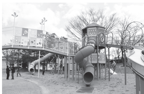
▲新しくなったわらしっこ広場遊具

11ページカメラ散歩でもお知らせしたとおり、3月25日、みずいろ公園わらしっこ広場の遊具をリニューアルしました。オープニングセレモニーでは、本宮第1保育所の年長組の園児たちが今日の日のため練習した踊りを元気いっぱい披露しました。 テープカットが終わると、園児たちと来場の皆さんが一つずつ風船を持ち、カウントダウンに合わせて青空に向かって飛ばし、リニューアルオープンを祝いました。 広場が開放されると、