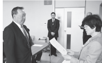
原瀬教育長から辞令を交付される公民館長・分館長の皆さん