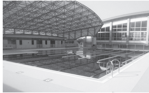
本宮まゆみ小学校の隣に建設された屋外プール

本宮まゆみ小学校の隣に建設を進めていた子ども屋外プールが完成し、3月25日、施工業者から本宮市へ引き渡されました。