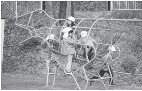
ジャングルジムで遊ぶ子どもたち（白岩幼稚園）