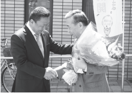
退任された中野前副市長（右）。8年間市政発展にご尽力されました