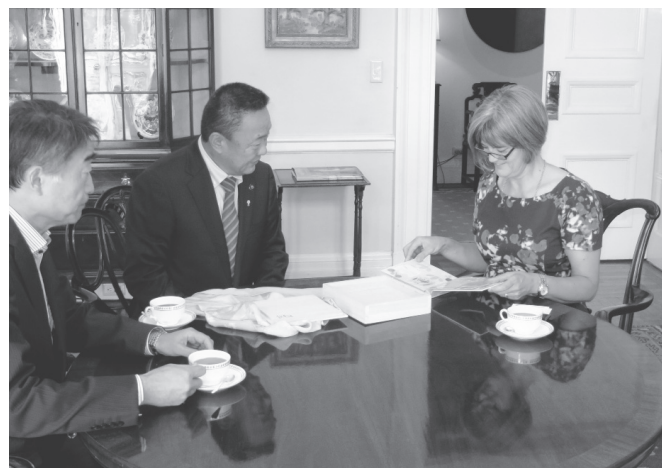
アルバムをご覧になるロングボトム公使(右)