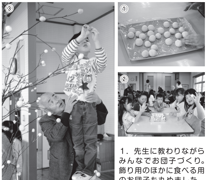
1. 先生に教わりながらみんなでお団子づくり。飾り用のほかに食べる用のお団子も丸めました 2. お団子、きれいに丸められました！ 3. できたお団子をミズキの枝に刺していきます。高いところは先生に支えられながら刺しました

私自身、親の代から受け継いで22、23歳の頃から50年以上作っています。郷土を愛する気持ちで長く続けています。これからもできる限り続けていきたいです。