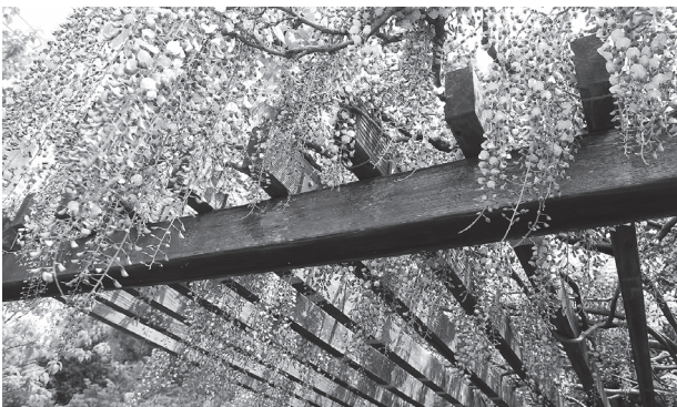
見頃を迎えたみずきが丘のフジ棚

みずきが丘住宅団地の春の風物詩ともなっているこのフジ棚は、団地の造成が始まった頃に植えられ、町内会の皆さんで毎年手入れされています。