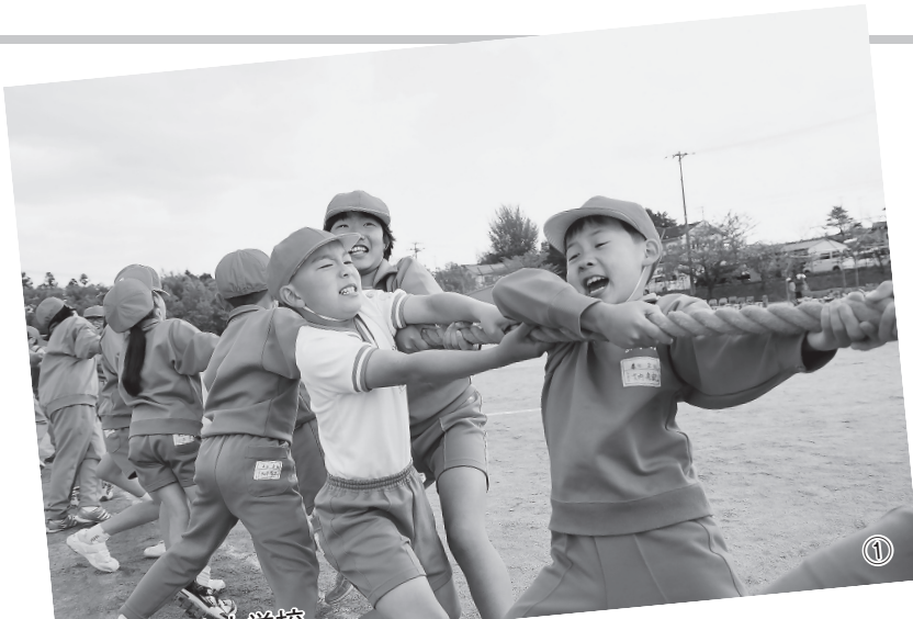
本宮まゆみ小学校