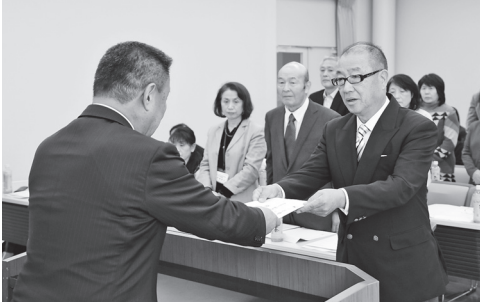
民生委員・児童委員の皆さんに高松市長から委嘱状が交付された

民生委員・児童委員の皆さんは、厚生労働大臣からの委嘱を受け、担当地区内の皆さんの相談に応じるほか、子どもたちの見守りなどを行います。秘密は守られますので、お気軽にご相談ください。