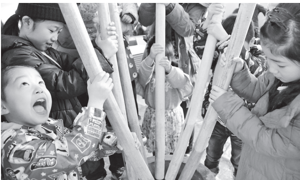
千本杵で威勢よく餅をつく子どもたち

1月9日、日本の伝統文化に触れてもらうことを目的にえぼか餅つき大会が行われ、約150人の親子連れが餅つきを体験しました。千本杵を使い、「よいしょよいしょ」のにぎやかな掛け声が会場に響きわたりました。体験のあとには、プロの作ったお餅がふるまわれ、あんこときな粉の甘くやわらかな餅の食感を楽しみました。