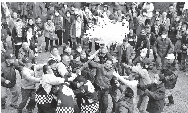
1年の福を願い、大梵天を取り合う参拝者

青竹で作られた大梵天の一部を持ち帰ると1年の無病息災・家内安全が約束されるとされており、用意された14本が境内に持ち込まれると、多くの参拝者が駆けより激しい争奪戦を繰り広げました。