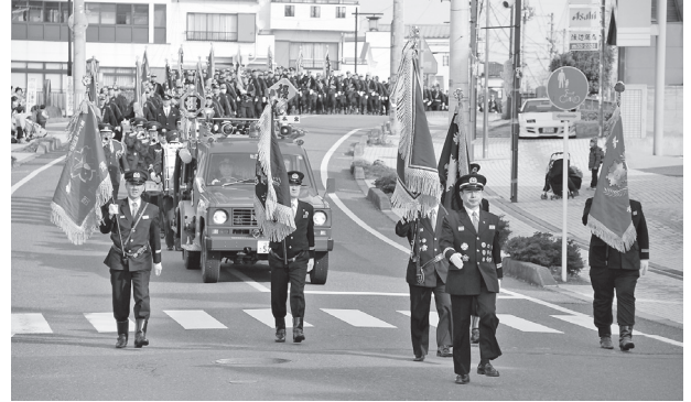
中心市街地を行進する本宮市消防団