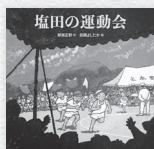
『塩田の運動会』 那須 正幹