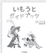
『いもうとガイドブック』 ポーラ・メトカーフ