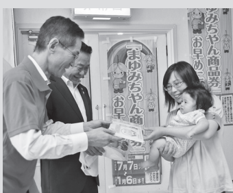
▲商工会が発行したプレミアム商品券

本宮市商工会が10周年を記念して発行するプレミアム商品券に対する補助を行います。