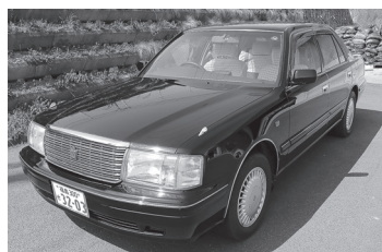
車名：トヨタ クラウン セダン (4門4ドア) 普通乗用車 (5人乗4ドア黒AT4WD) 排気量：2,490cc 燃料：ガソリン（無鉛プレミアム） 登録年月：平成12年5月 車検有効期限：なし（平成29年5月18日満了） 走行距離：81,278km（保守のため、走行距離が増えることがあります）