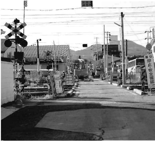
来年度工事を予定している大縄堀踏切