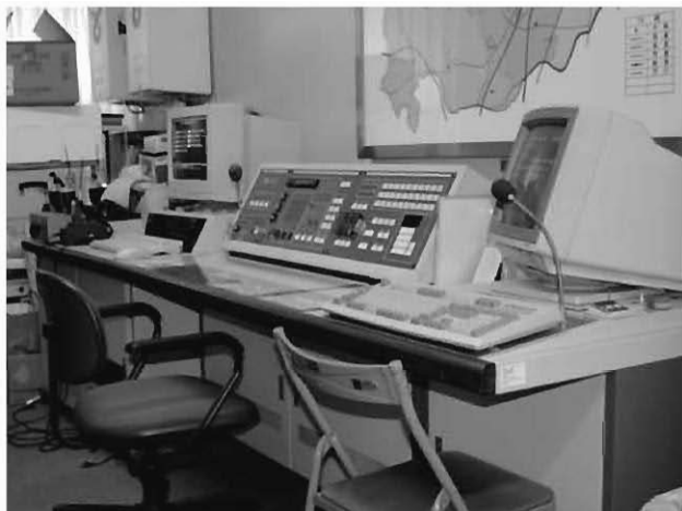
瞬時警報システムが付加される操作盤

や早期に実施すべき事業への予算計上を行いました。財源の主なものは、国・県からの交付金などです。