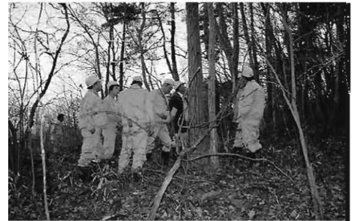
現地調査（カシノナガキクイムシ被害状況…岩根地区）