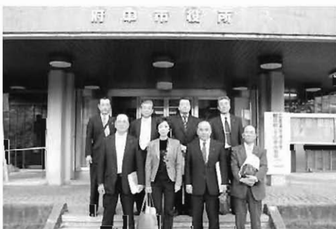
広島県府中市役所にて

本市でも、他地域同様、市街地空洞化の厳しい現状下にあります。駅前開発を契機に、賑わいのあるまちづくりをしてまいります。