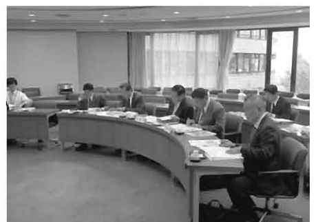
大分県別府市役所にて

事業内容としては、直方市と国土交通省で施工箇所を区分しており、直方市では放水路、国土交通省では排水ポンプ場、グラウンド