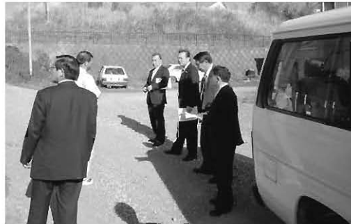
現地調査（市道改良要望箇所）

流域下水道県中浄化センター等における各施設の拡張や修繕に要する経費のうち、関係市町で按分した応分の負担である。