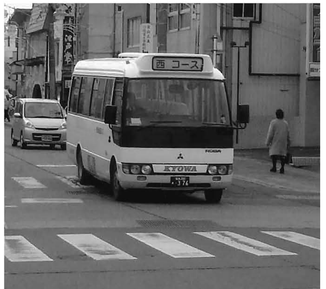
利用しやすい公共交通の構築を

【他市を参考に検討中】 【答】 国の助成制度として設置者に1キロワット当たり7万円の補助がある。本市の地域新エネルギービジョン策定後に、他市で実施している太陽光発電設備設置の助成制度創設等も含め、新エネルギー対策を検討したい。