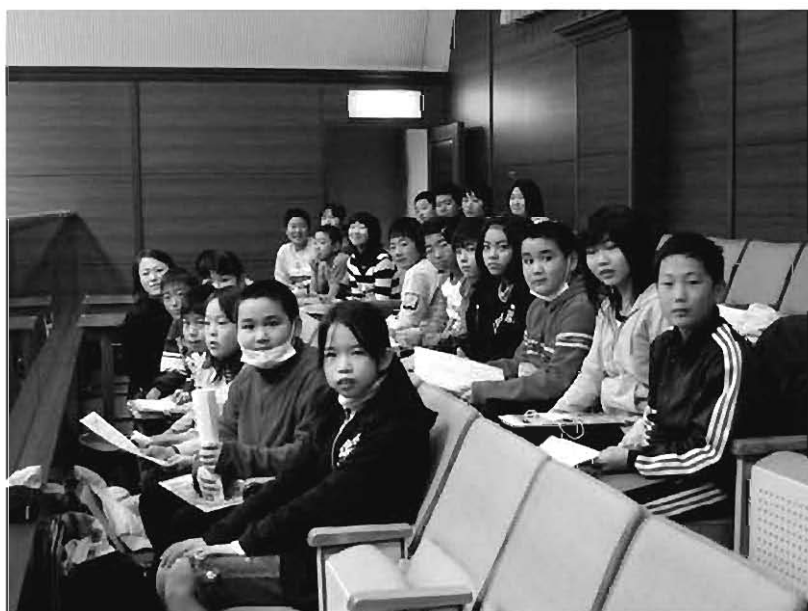
議会を傍聴した岩根小学校6年生のみなさん

市議会のみなさん。これから市民の願いをかなえてすてきな本宮にしていってください。ありがとうございます。