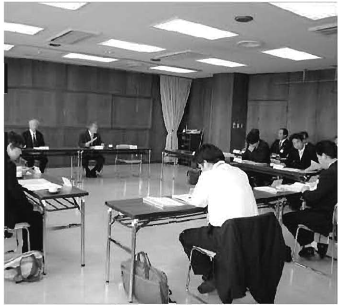
5回の開催を教えた駅利用促進検討委員会

問 ①全国学力・学習状況調査(全国学力テスト)が抽出方式に切り替わる公算が強いと思うが、その対応の基本的な考え方は。 ②保護者の7割が学校別成績の公表を求めているが、市の教育委員会の対応はいかに。