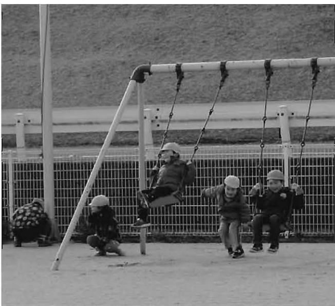
寒空の中元気に遊ぶ園児（第一保育所）