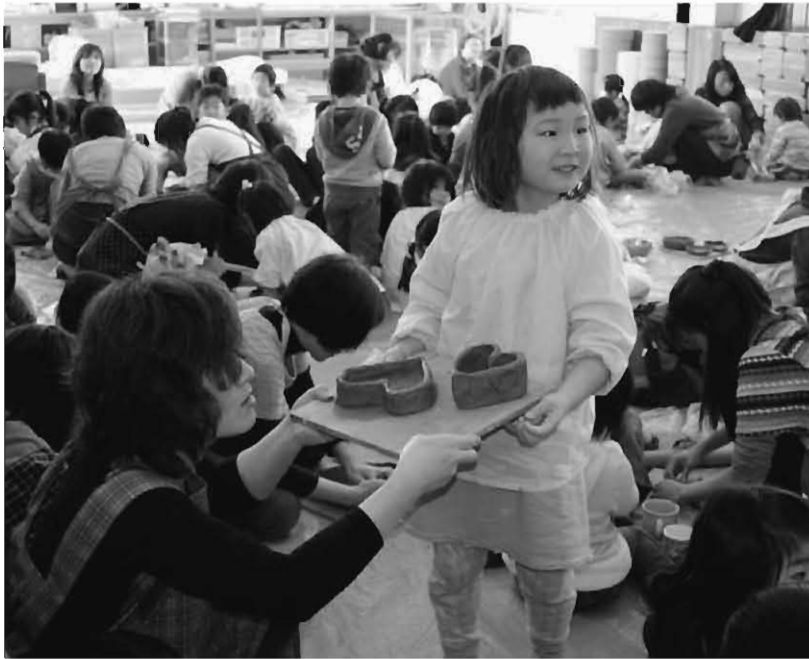
先生できました (岩根幼稚園参観日・年長組の陶芸作り)