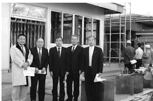
現地調査（岩根幼稚園園舎増築工事）