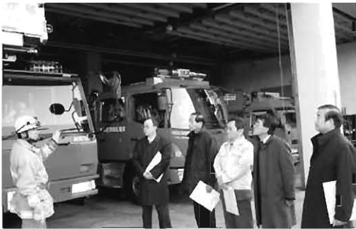
現地調査（消防本部）

担保能力がありながら納付に応じない滞納者には、保険給付を一時的に停止する資格証の交付を行っている。