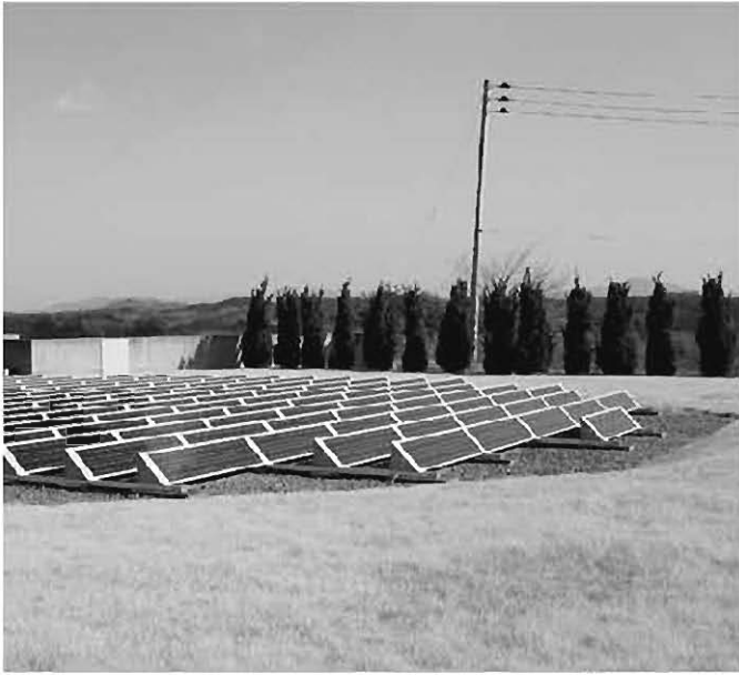
ソーラーシステムを設置している市内企業

問 デフレが宣言されるような経済不況化が進行し、市民の働く場、雇用や生活が厳しさを増していく中で、税の滞納者、とりわけ生活困窮者に対する対策を市はどのようなか。