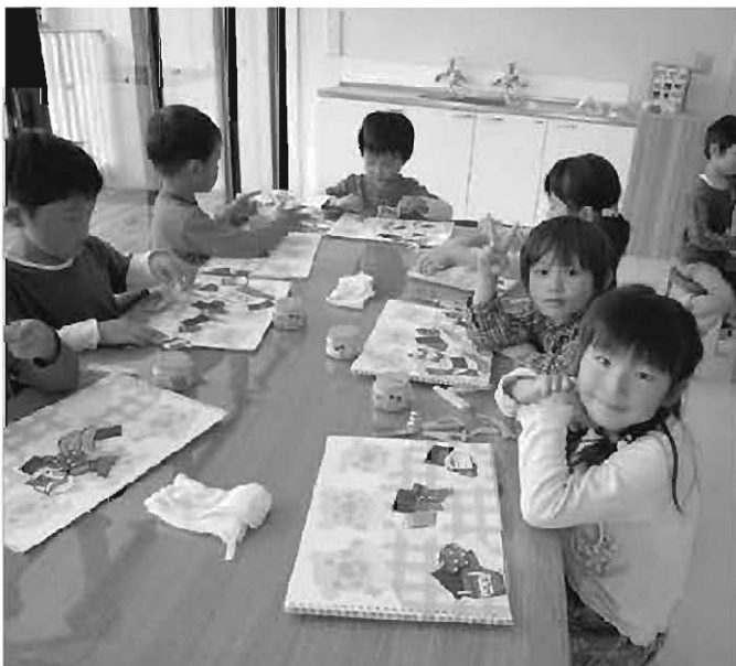
子育て支援は新年度予算の大きな柱(えぽか)

答 「22年度までの国の補助事業」 ①昨年の5月から5回開催し、ソフト面、ハード面の提言をいただいた。提言をできるだけ実行に移したい。 ②交通バリアフリー化整備費補助金は平成22年度までの設定であるが、期間延長等については、国の方針が示されていない。