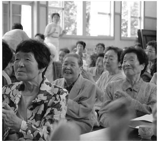
楽しい余興に盛り上がりました（高木地区敬老会）

【プロジェクトチームで検討している】 答 待機児童ゼロに向け、保育サービスの利用拡大など次世代育成支援行動計画推進プロジェクトチームで検討している。保育所と幼稚園の料金の格差の問題は、プロジェクトチームの経過も踏まえ検討していく。