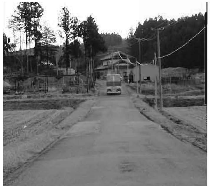
合併時の構想事業はいつに（一斗内・赤坂線）