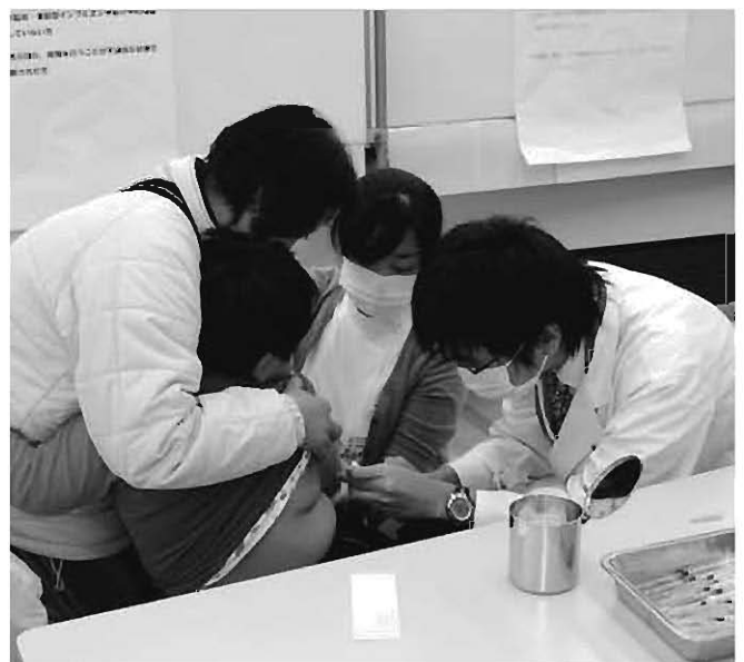
新型インフルエンザワクチンの集団予防接種 (えぼか)