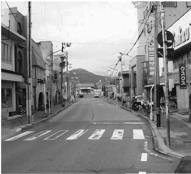
市街地空洞化に歯止めを

問 駅前の店舗が移転するという。東口駅前広場など、まちづくり交付金事業等で、公共資本投資がなされ、街並みを整備すれば空洞化は防げるのか。また、車社会の今日、駅利用の促進では、効果は期待できないと思うが。