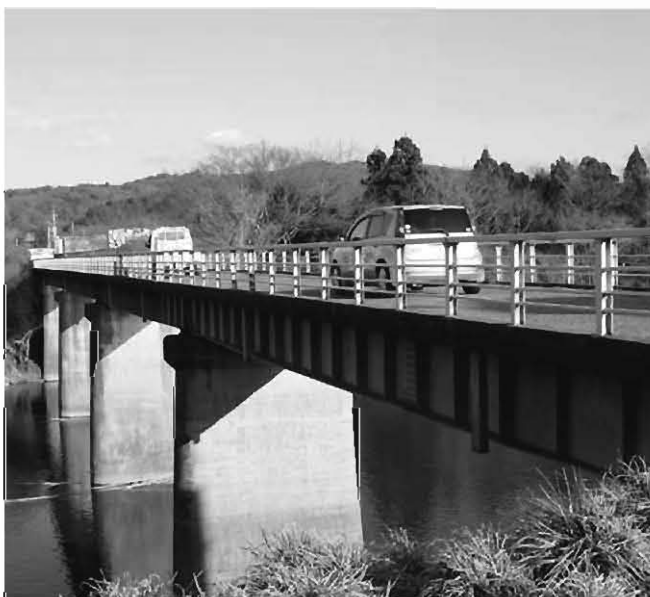
幅員が狭く老朽化が進む上ノ橋

【難問であるが解決に努力する】 【答】 子どもを産みやすい環境づくりは住みやすい環境づくりでもあり、待機児童ゼロに努める。介護施設待機者は約150名。家族の苦労は理解している。今後、社協が小地域ネットワーク事業で高齢者の見守りを行う予定であり、協力し進める。