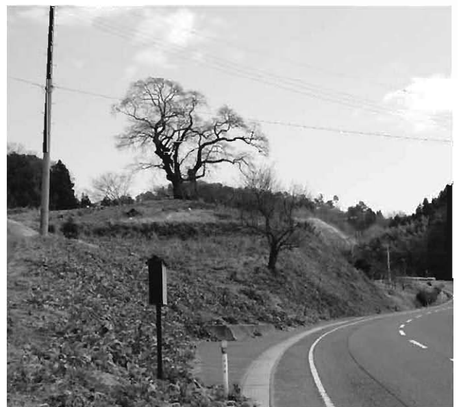
春の訪れを待つ塩ノ崎の大桜

答 新生児に係る部分は、今後の検討課題であると思うが、現在、小学6年生までの医療費の無料化など助成拡大が行われているため、現時点では祝い金の支給は考えていない。