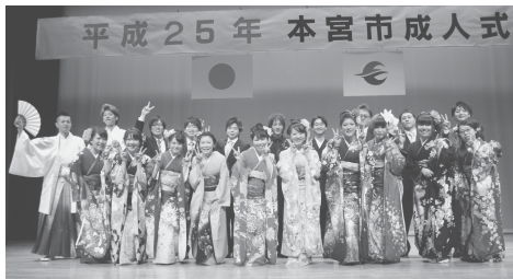
成人式記念事業実行委員会の皆さん