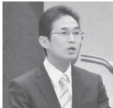
◀「ひとつの判断で勝負が決まる。的確な判断と感謝の気持ちを忘れずに多くの人から感謝される人間になってほしい。」と恩師を代表して渡邊康彦先生から祝辞をいただきました