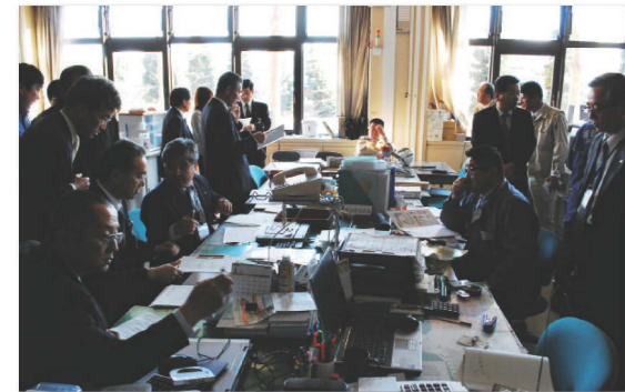
3月11日午後4時30分、災害対策本部の様子。停電・電話も不通になった