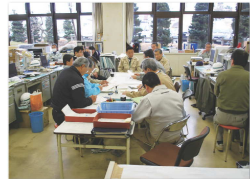
3月16日午前8時30分、災害対策本部会議の様子。被害の全容が明らかになった