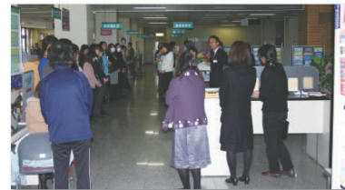
3月11日午後4時、女性職員が集められ、震災対応状況について説明を受ける