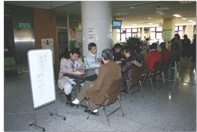
3月12日午前9時、市役所に設置された被災相談窓口の様子