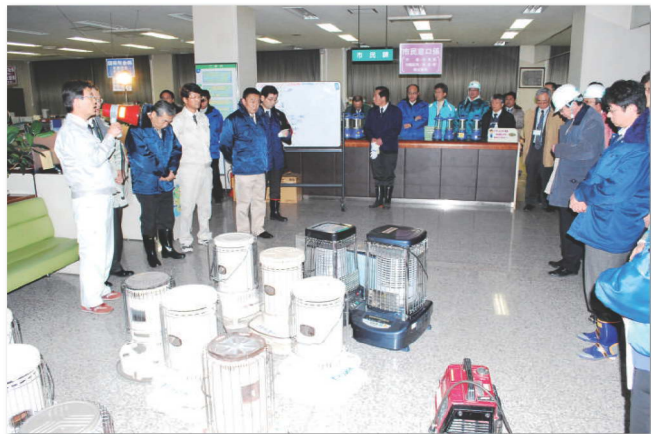
各避難所の対応について職員に指示が出された (3月11日午後7時40分頃、市役所内の様子)