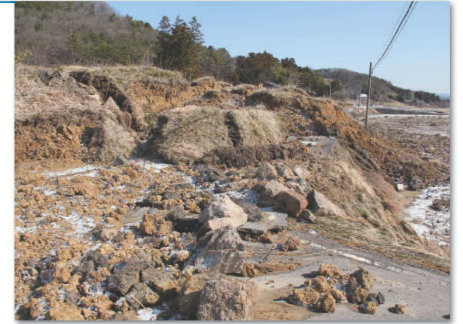
青田新池の堤体崩落

地震発生直後、市では災害対策本部を設置。被害状況の把握のため、市職員、消防署員、消防団員、郡山北警察署本官分庁舎署員で情報収集にあたった。