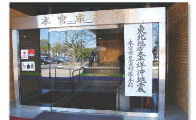
市役所入口に掲げられた災害対策本部の垂れ幕