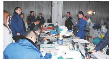
3月11日午後7時20分、災害対策本部の様子。消防署員と情報収集にあたる市職員。夜通しの対応となった