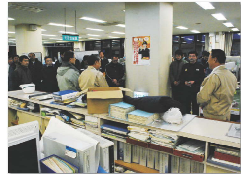
3月12日午後6時、男性職員が高松市長(右)から避難所の対応について指示を受ける