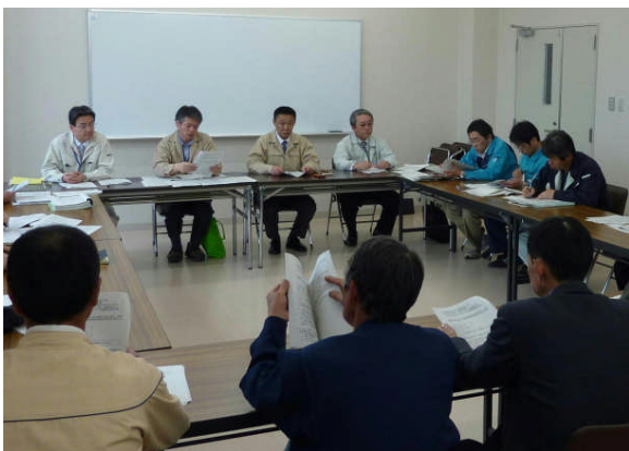
▲高松市長としいたけ生産者の皆さんで、収穫した露地栽培の原木しいたけの処分方法や損害賠償などについて話し合いが行われました

4月22日に市内で採取された露地栽培の原木しいたけから、国の暫定規制値を超える放射性物質が検出されたことを受け、その経過と今後の対応について意見交換を行うために開催されたものです。