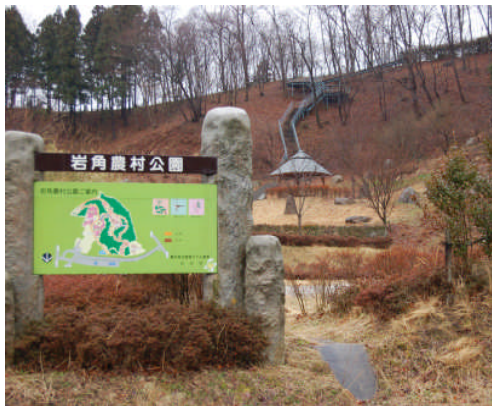
▲和田字東屋口地内にある岩角農村公園。隔週2回の調査で規制値を下回り、利用制限が解除されました