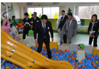
(上右) えぼか内を視察する復興相 [中央] (上左) スマイルキッズパークを視察。子どもたちと一緒に遊ぶ (下) 地元の方々にあいさつする復興相