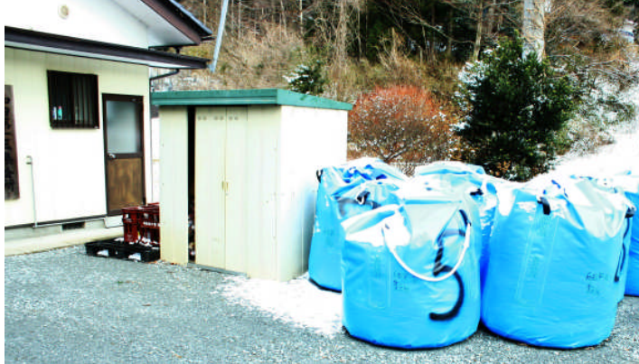
(写真右)和田1区集会所。和田地区では、住宅の除染を進める一方、集会所など人の集まる施設の除染作業も同時に進めています。除染作業が終了した施設には、耐候性のあるフレコンバッグに土砂などが詰められています。 (写真左)和田9区集会所。駐車場の碎石が入れ替えられ、きれいに整地されました。