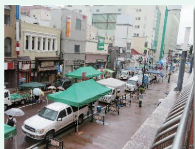
「福島駅前軽トラ市」の様子

同イベントは福島市の主催であり、本市が「ふくしま田園中枢都市圏」の構成団体であることから、今回の参加に至りました。同イベントには福島市内の農家や同じく構成団体である川俣町、阿武隈川流域連携市町村である矢吹町も参加し、福島駅前通りを利用した大きなイベントでした。