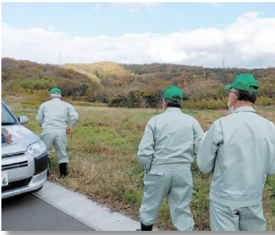
農地パトロールの様子

管理がされていない農地は害虫や病気の発生源になってしまったり、畑を荒らす猪など有害鳥獣の住処になってしまったりなど、近隣農地へ悪影響を与える可能性がありますので適切な管理を行い農地を守っていきましょう。