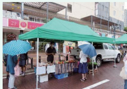
若手農業団のブース

となりましたが、同農業団の積極的な呼び込みもあり、多くの買物客が訪れました。同イベントでは新鮮野菜や果物を活かした「6次化商品」が多く販売されました。「6次産業化」は団が掲げる目標の一つです。同農業団では、今後も活動の幅を広げ、地域の活性化に向けて取り組む予定です。