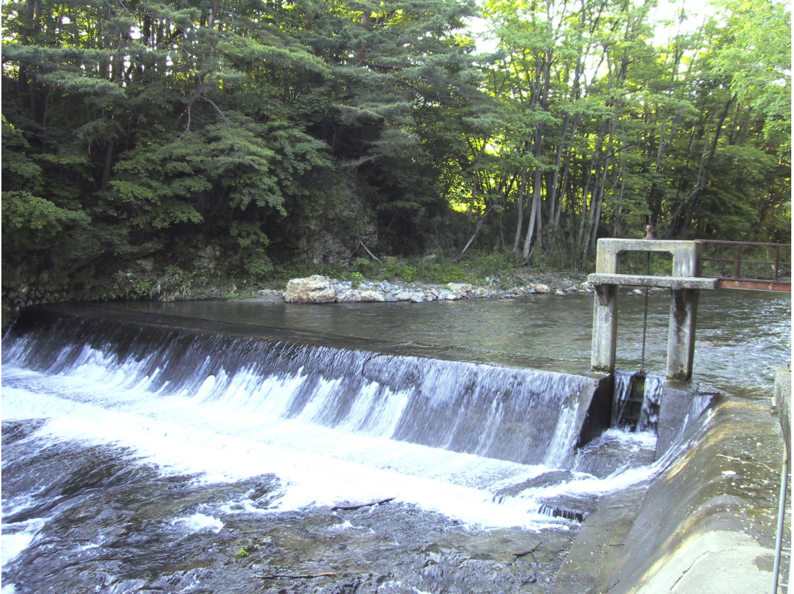
水源：石籠川 日影沢堰