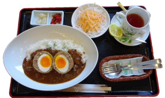
本宮烏骨鶏の卵を使った スコッチエッグカレー ¥1,280

卵とお肉の美味しさが絶妙なスコッチエッグとスパイス香る本格ビーフカレーとの相性バツグン！ 最後は紅茶で優雅なひと時を！