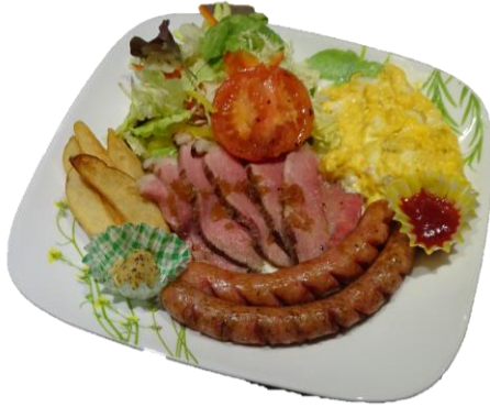
ローストビーフプレート ¥1,280

ローストビーフを食べる習慣のある英国民ポテト・卵・ソーセージをのせワンプレートにしました ライ麦パンとスープがセットでついてきます